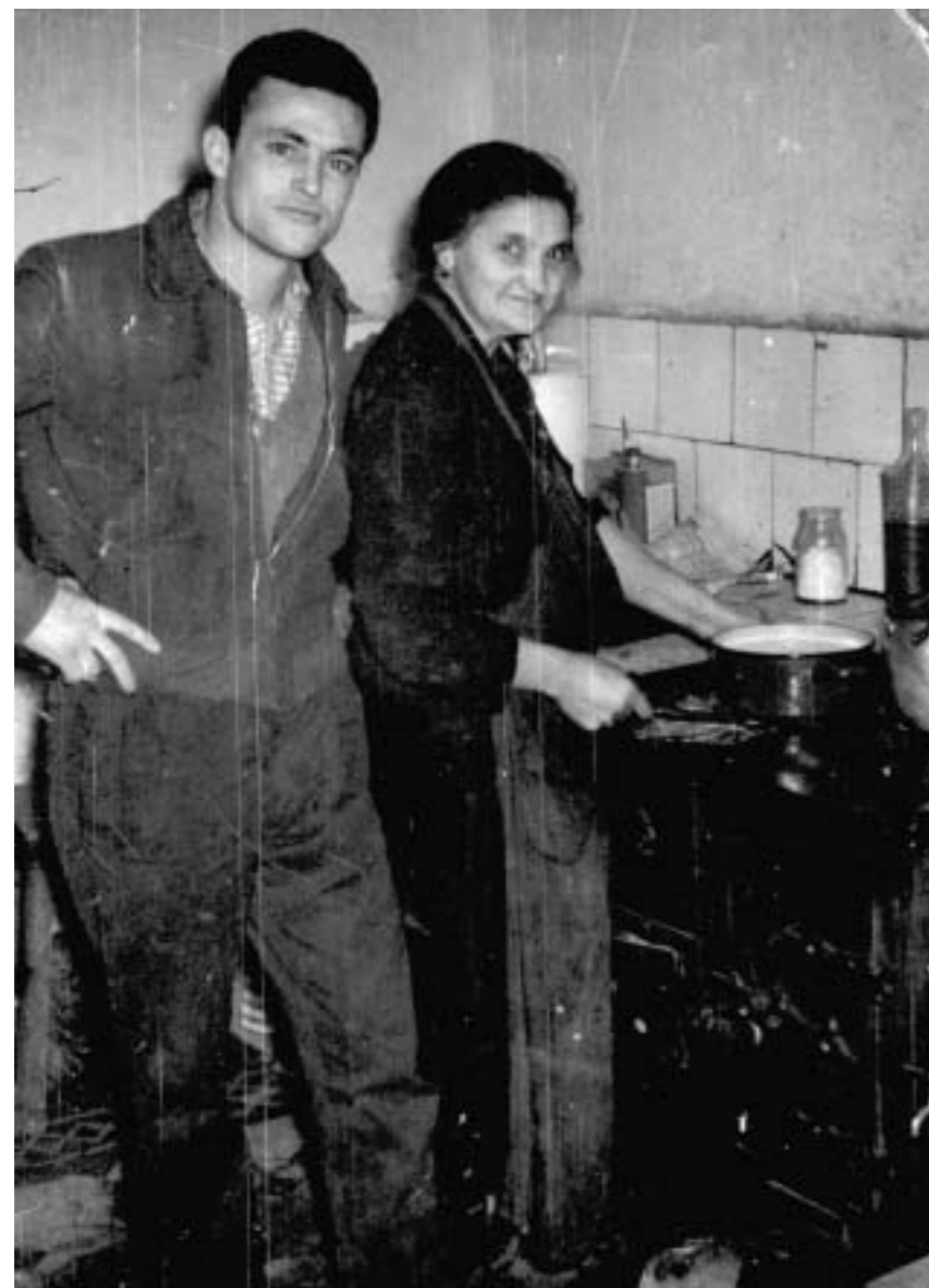
8. Estar de patrona. Bilbao, 1950.