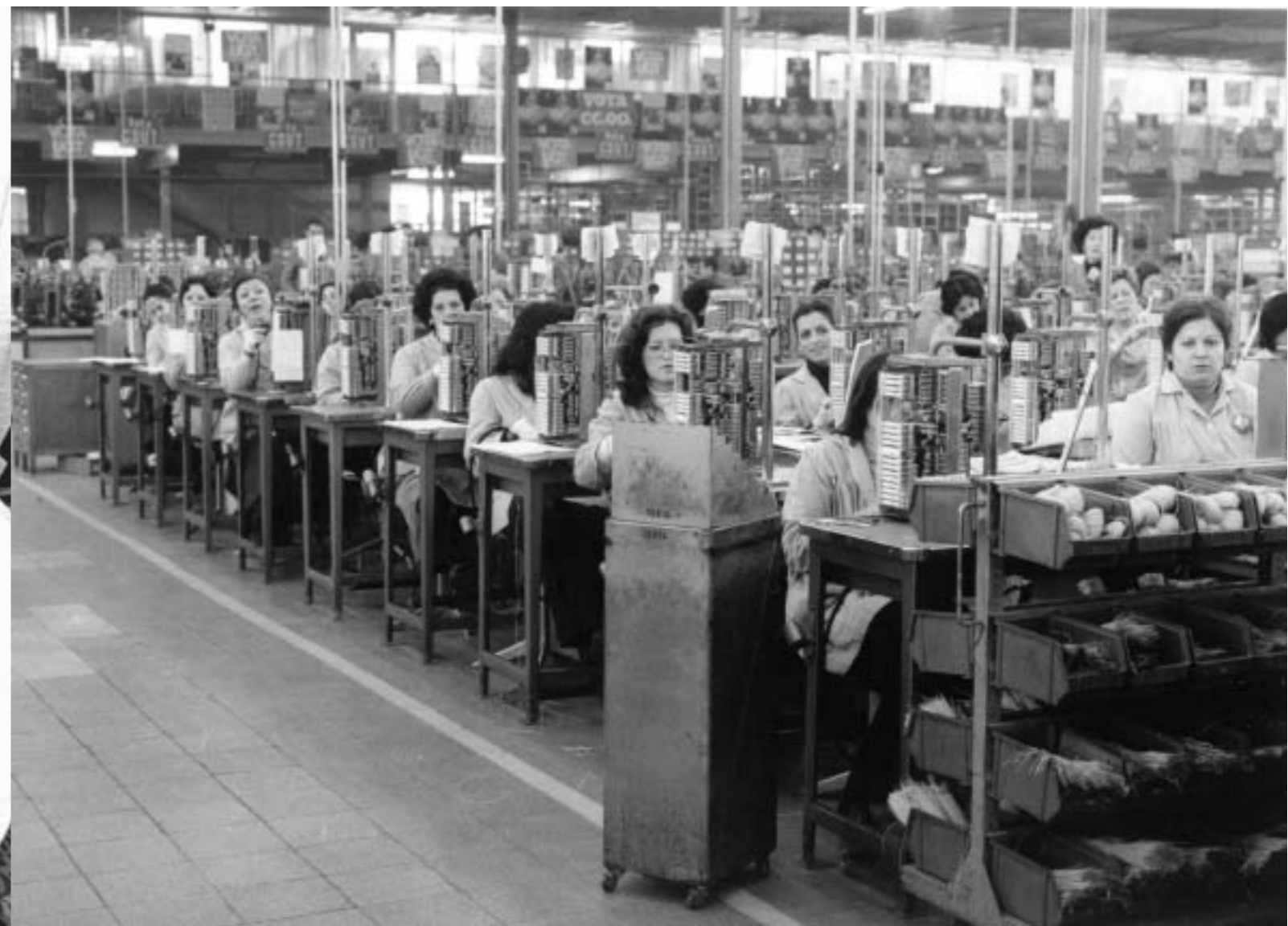
41. Nave industrial. Standard Eléctrica. Talleres de Villaverde, Madrid. 1977.