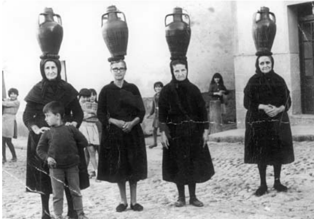
6. Aguadoras. Cáceres, 1950.