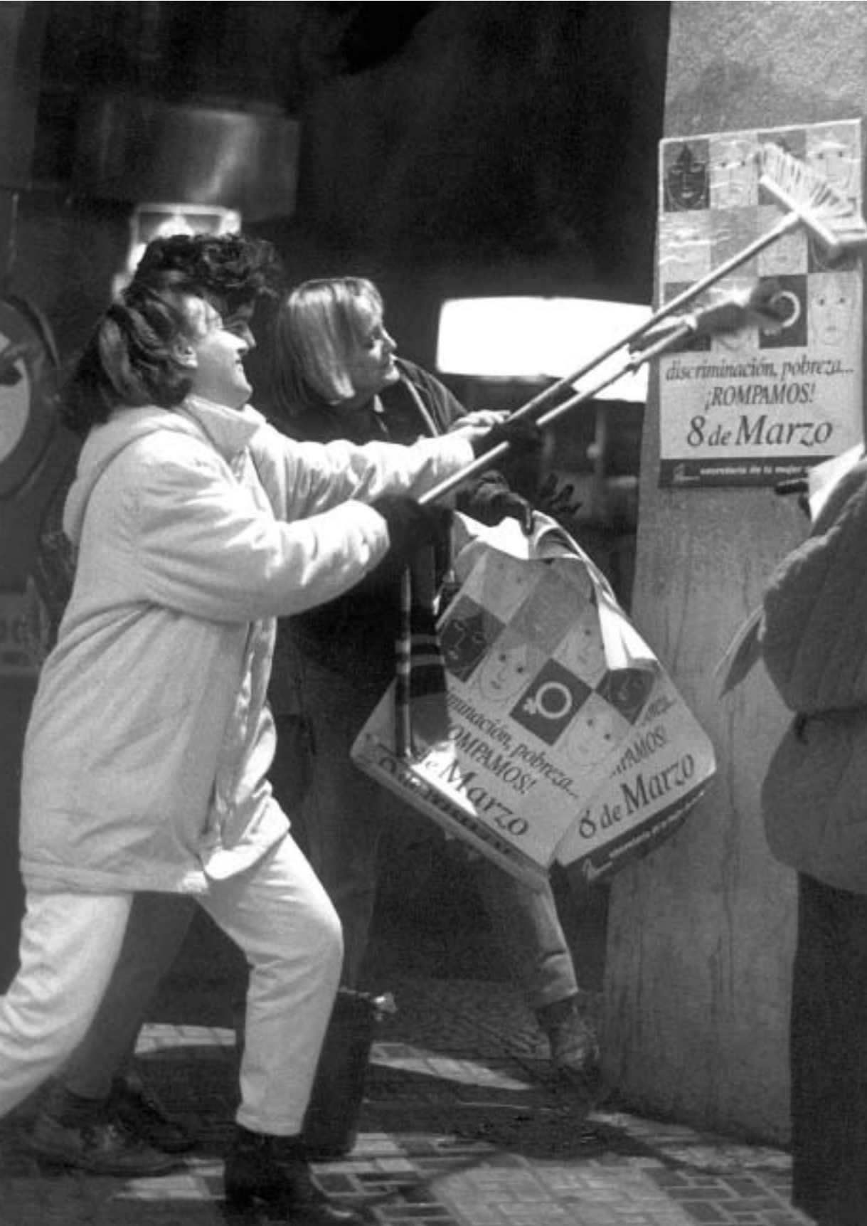
65. Pegada de carteles con motivo del 8 de marzo. CC.OO. de Extremadura (colección Secretaría Confederal de la Mujer de CC.OO.).