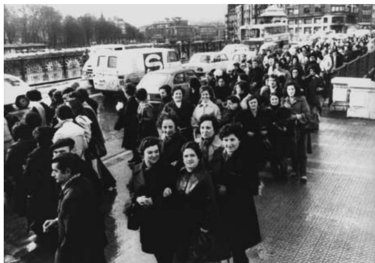
42. Grandes almacenes. s. l.; s.f. (foto Se-Grá, Fundación Cipriano García, Arxiu Históric de CC.OO. de Catalunya).