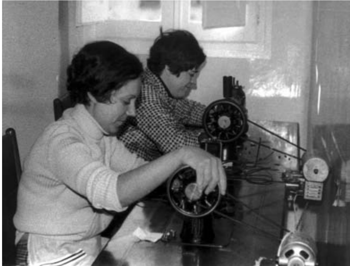
22. Trabajo a domicilio. Valencia, años sesenta-setenta (fotoRizos. Fundación Cipriano García, Arxiu Històric de CC.OO. de Catalunya).