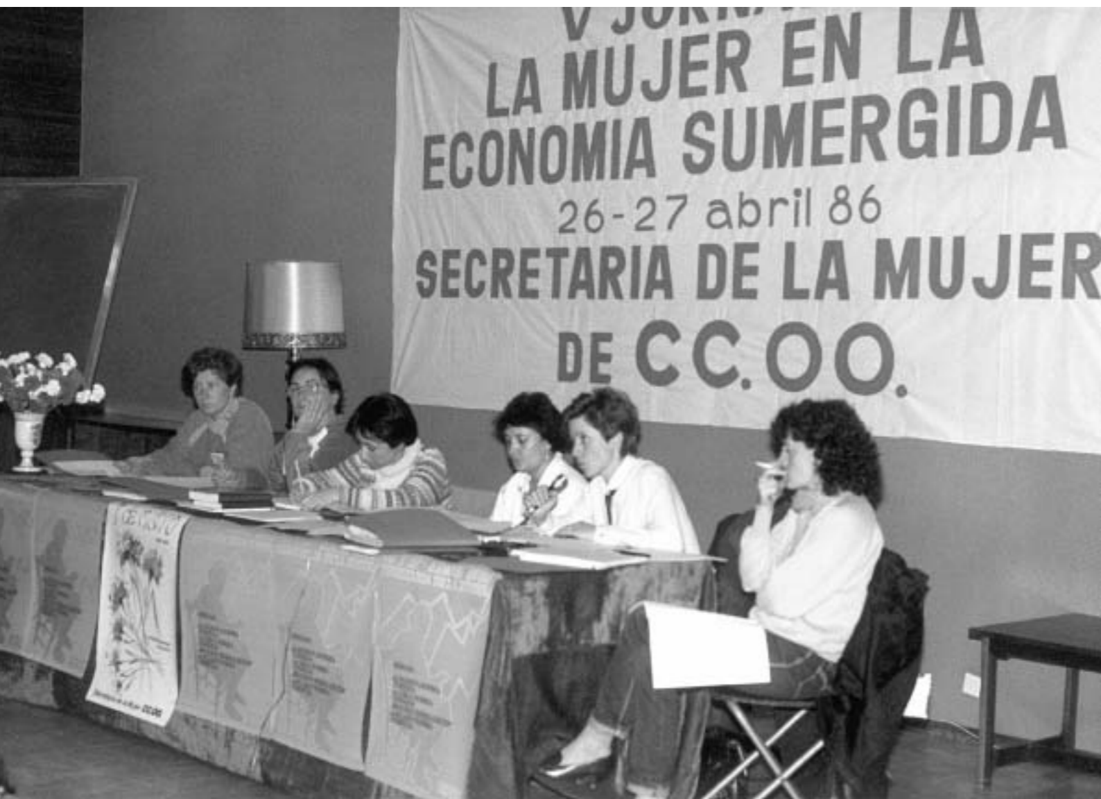
61. La mujer en la economía sumergida, Jornadas Confederales de la Mujer de CC.OO., 1986.