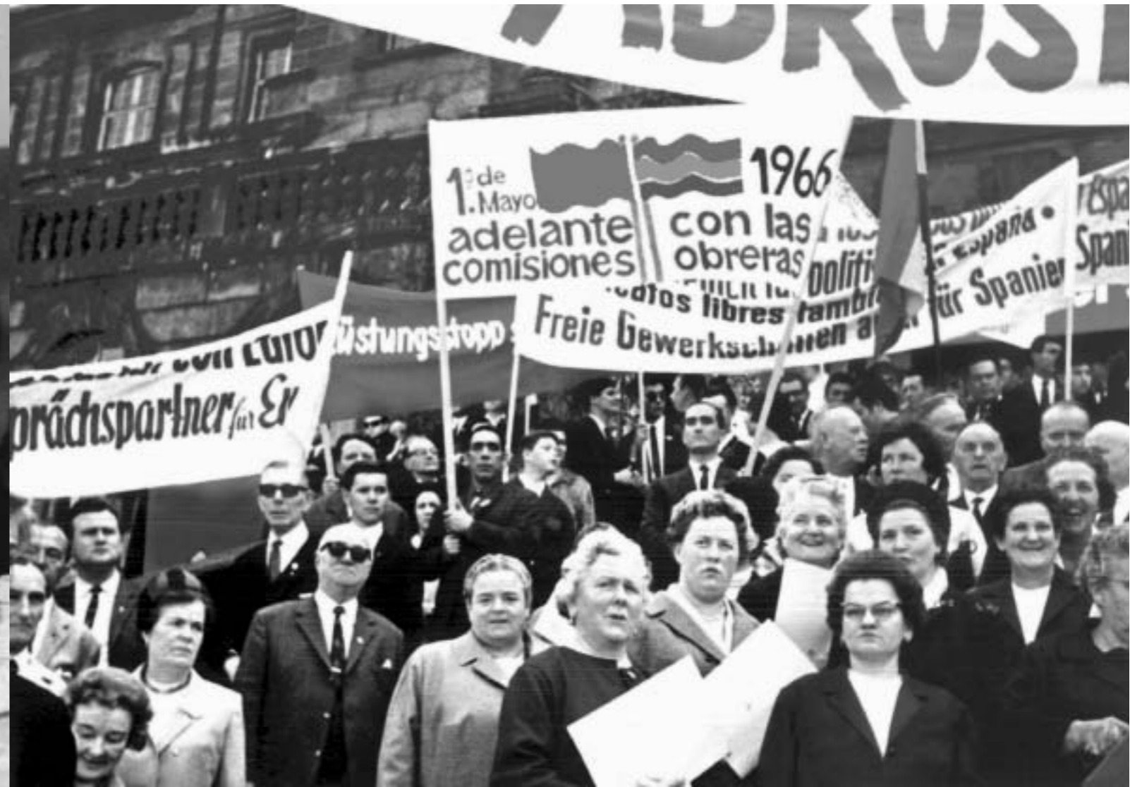
35. Manifestación 1º de Mayo. Alemania, 1966.