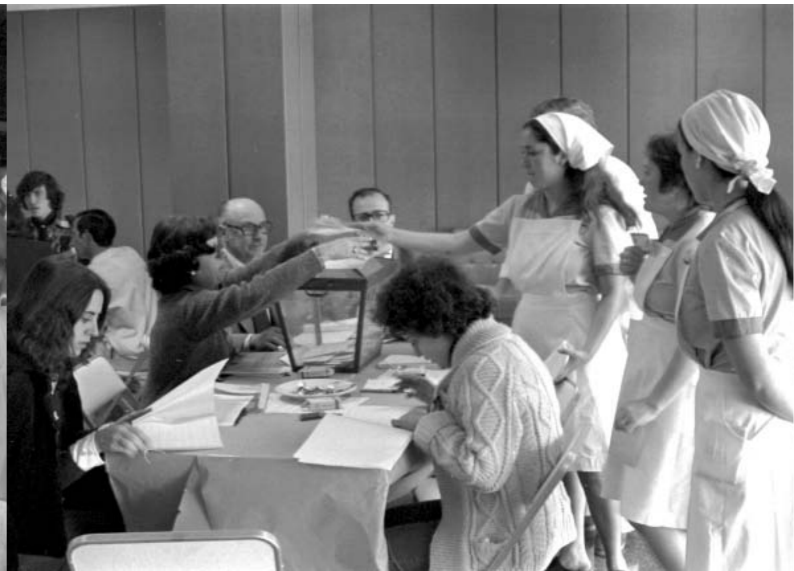
55. Elecciones sindicales, 15 marzo 1978. Hospital Ramón y Cajal, Madrid (colección Unidad Obrera, CC.OO. de Madrid. Archivo de Historia del Trabajo, Fundación 1º de Mayo).