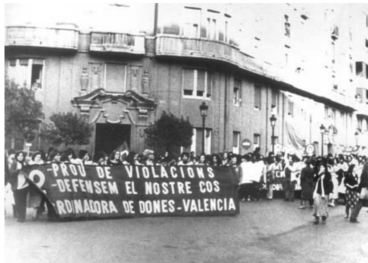
60. Manifestación contra las violaciones. Valencia, s.f..