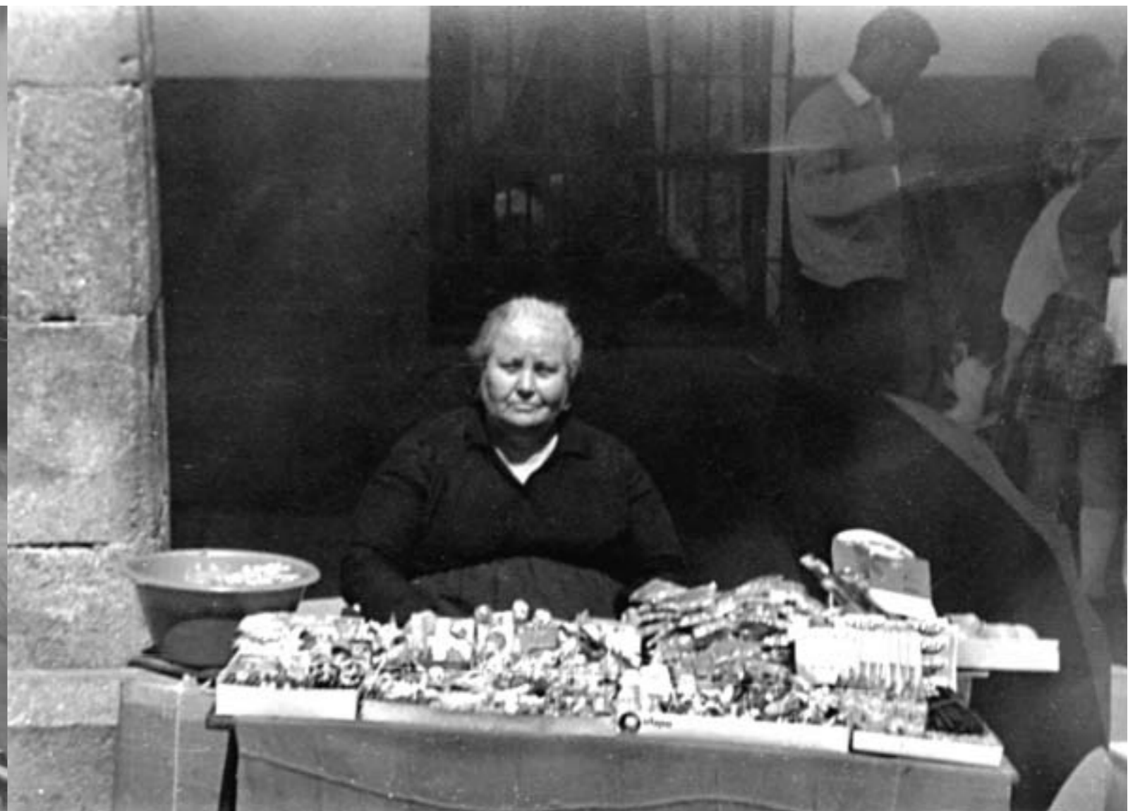
11. Vendedora de chucherías. Arroyo de la Luz, Cáceres. 1955.