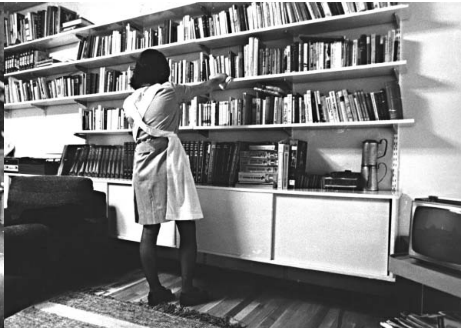
28. Empleadas de hogar. Años sesenta.