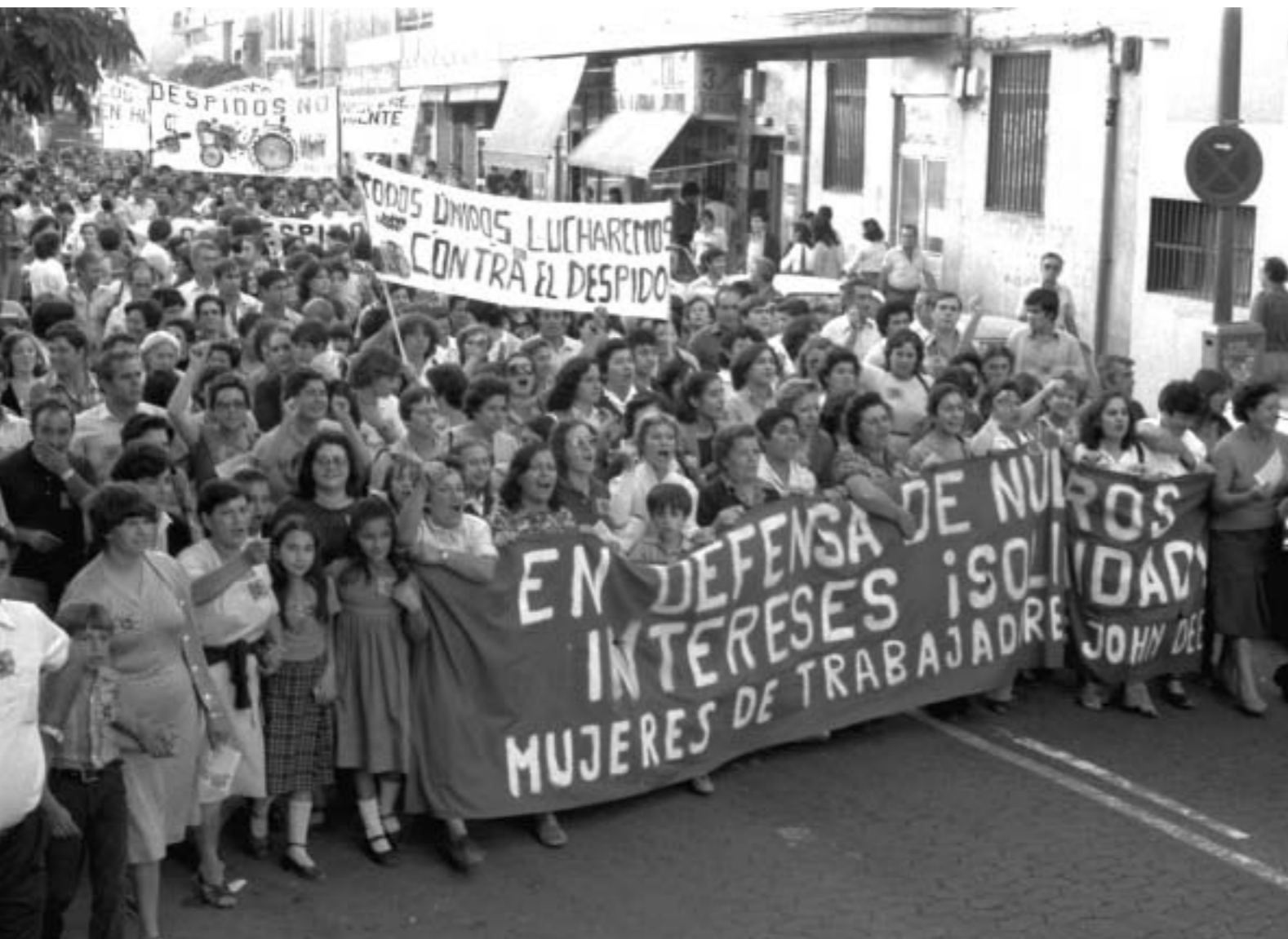
52. Manifestación de solidaridad de esposas e hijos de los trabajadores de John Deere. Getafe, 25 octubre 1981 (colección Unidad Obrera, CC.OO. de Madrid. Archivo de Historia del Trabajo, Fundación 1º de Mayo).