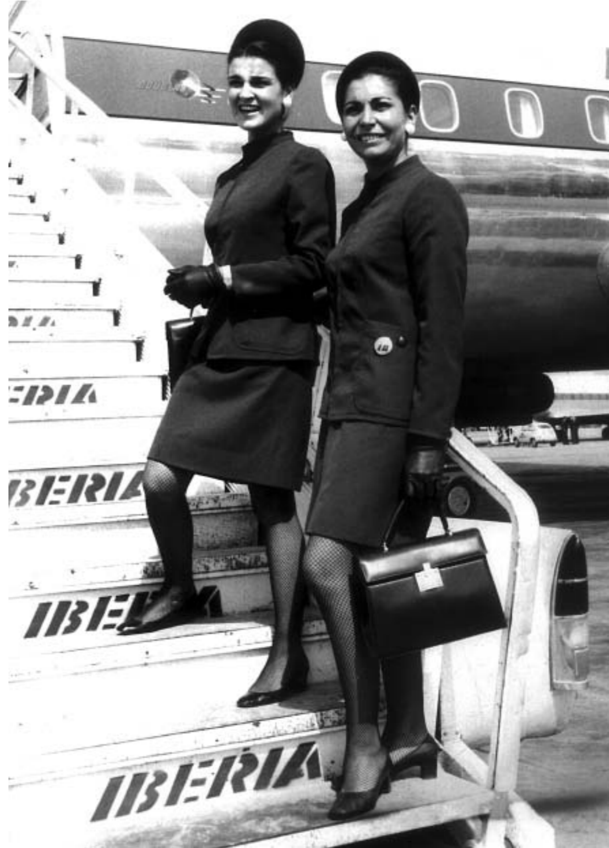
33. Azafatas de Iberia, 1968-1972.