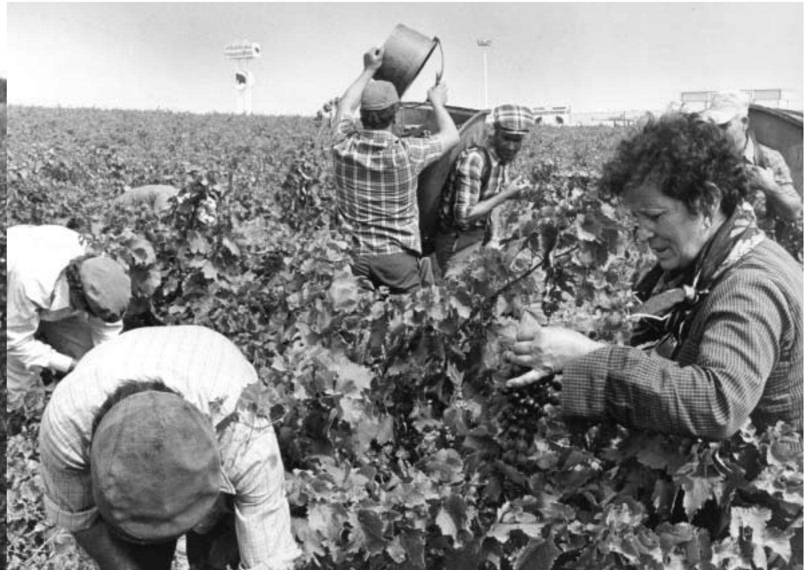
19. En la vendimia francesa, 1973.