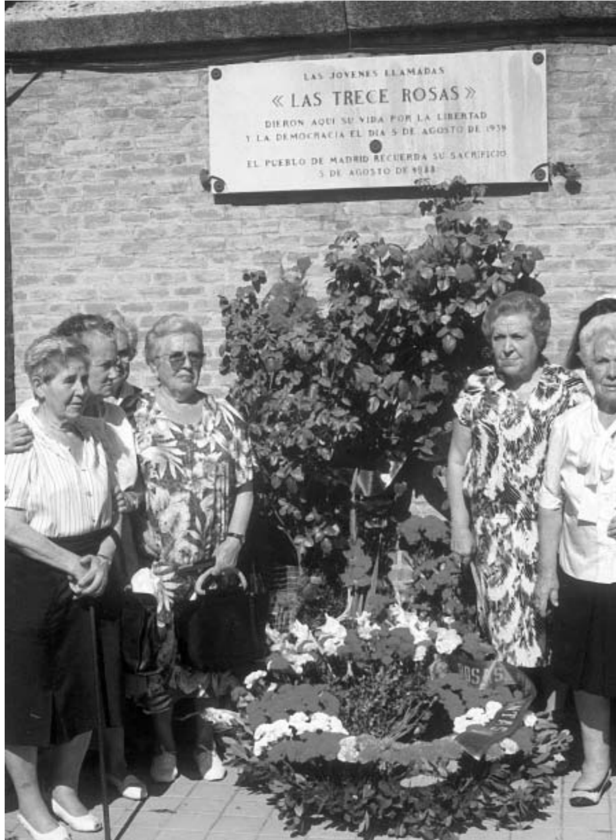
1. Homenaje a las Trece Rosas, militantes de la JSU fusiladas en 1939 por el régimen de Franco.