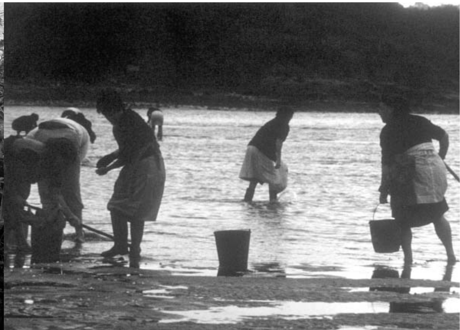
70. Mariscadoras, 1990.