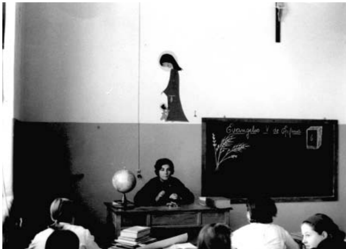
32. Maestra. Valencia, 1960.