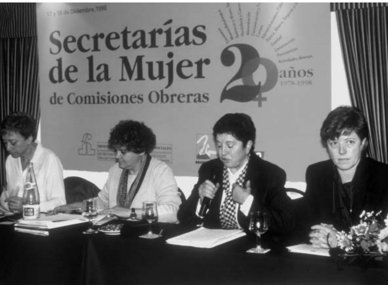
67. 20 años de las Secretarías de la Mujer de Comisiones Obreras, 1998.