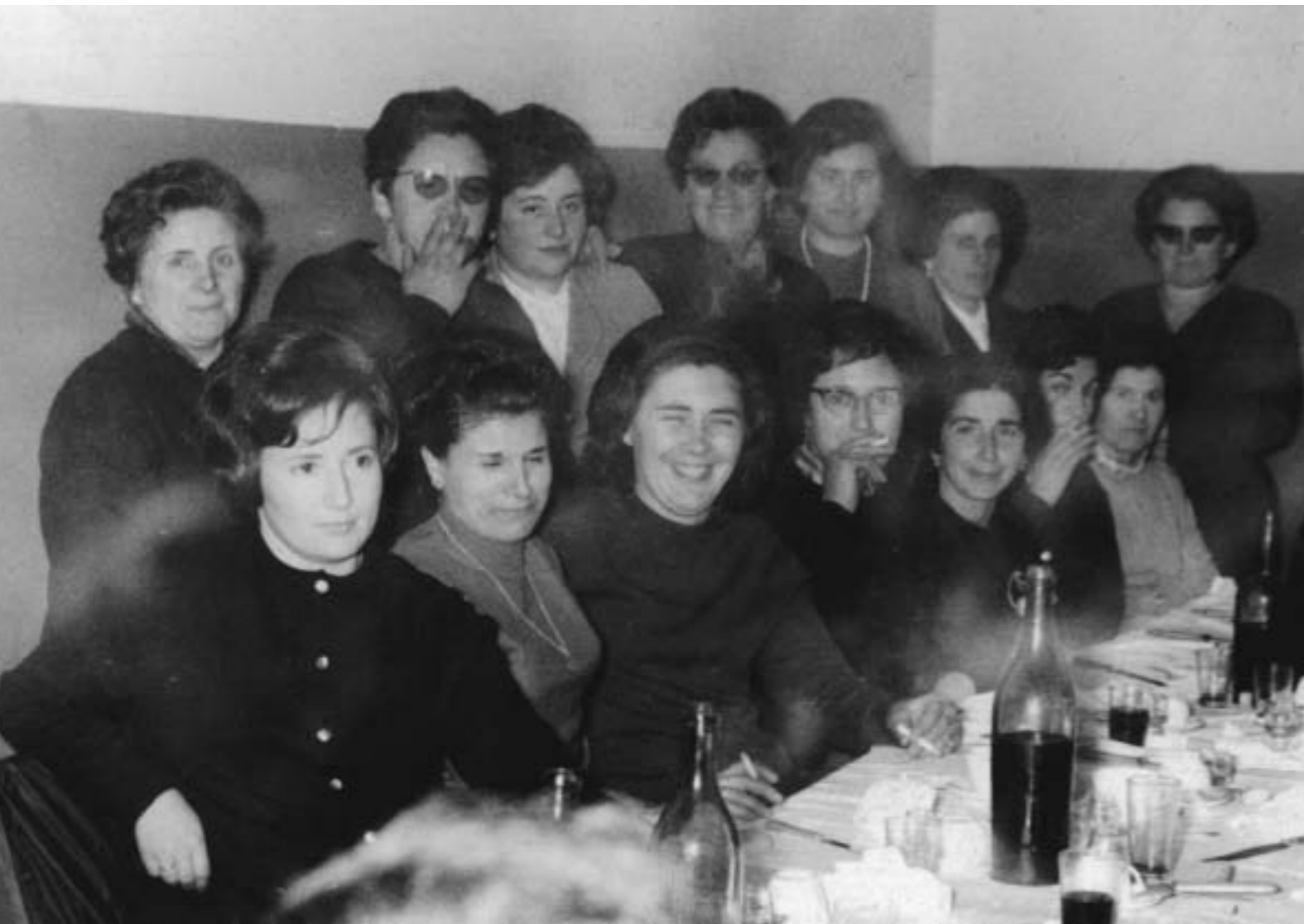
34. Esposas de mineros asturianos desterrados tras las huelgas de 1962 (Archivo Fundación Juan Muñiz Zapico, Asturias).