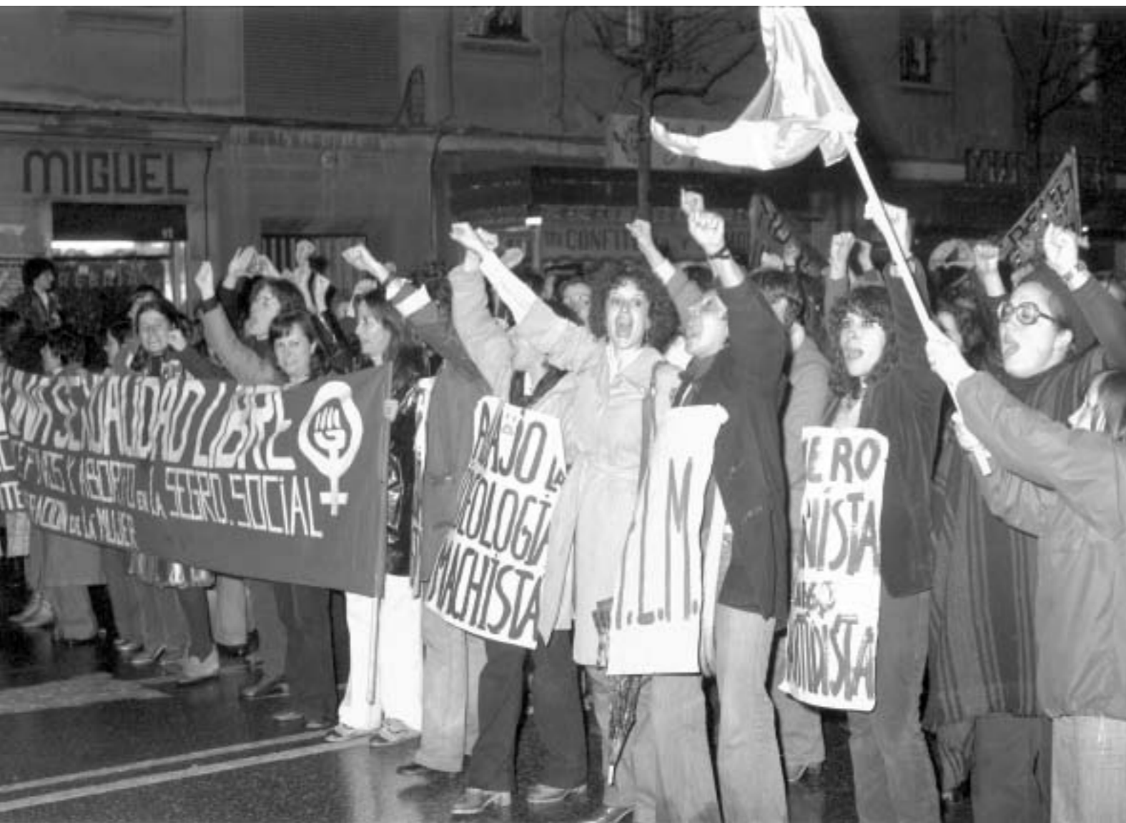
54. Manifestación 8 de marzo de 1978. Madrid.