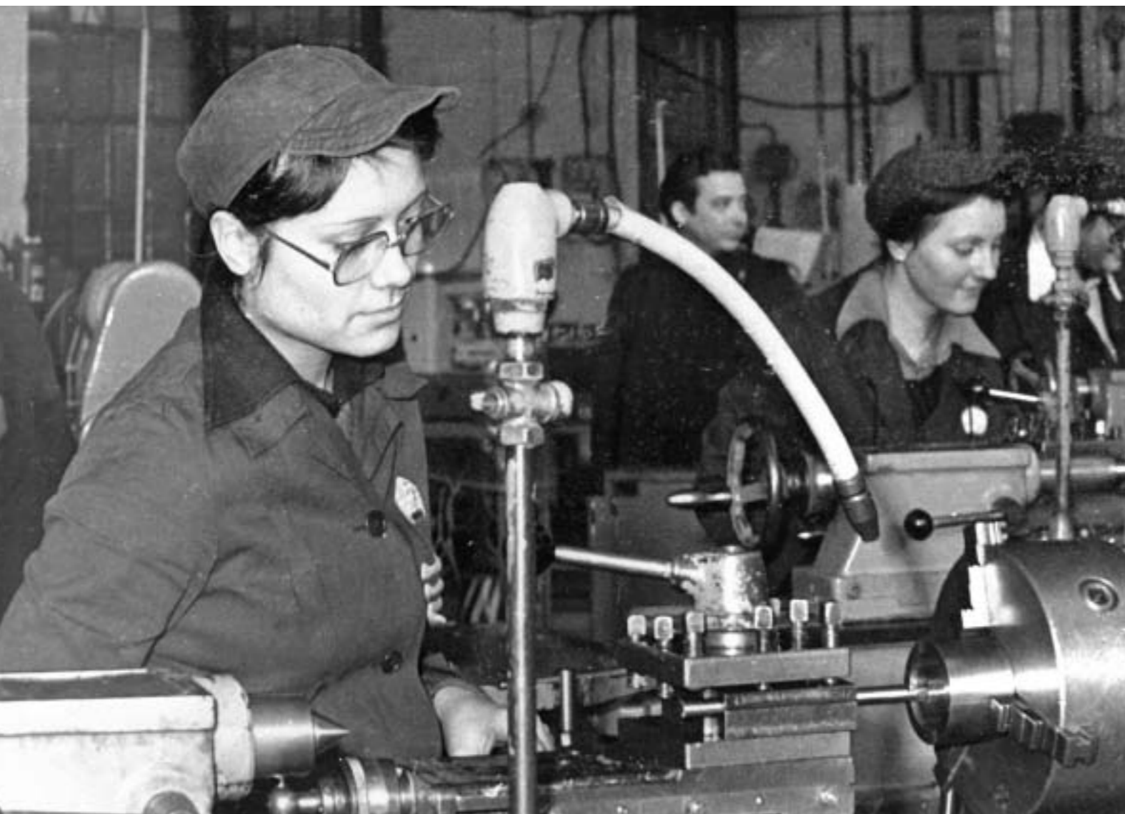
27. Chicas en la escuela de aprendices de SEAT. Barcelona, principios de los años sesenta. (foto cedida por la empresa SEAT a través de la Federación Minerometalúrgica de CC.OO.).