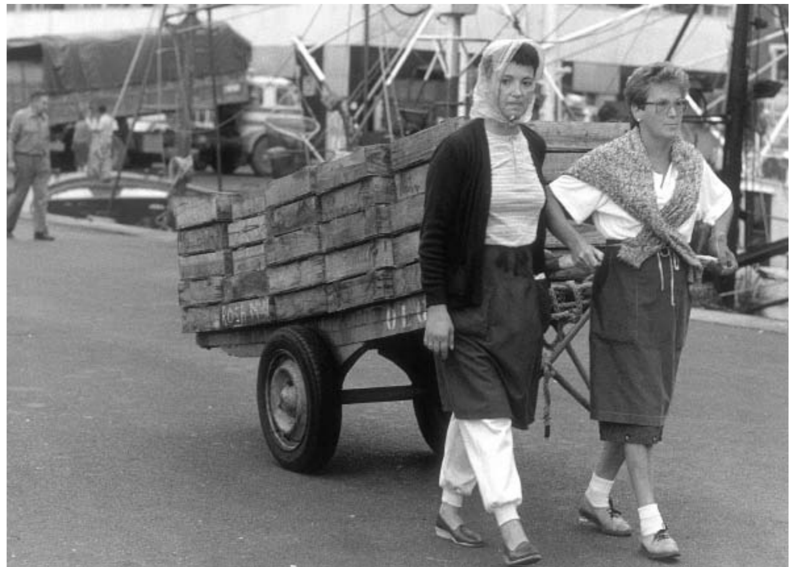
39. Vendedoras de pescado. s. l.; s.f. (colección Secretaría Confederal de la Mujer de CC.OO.).