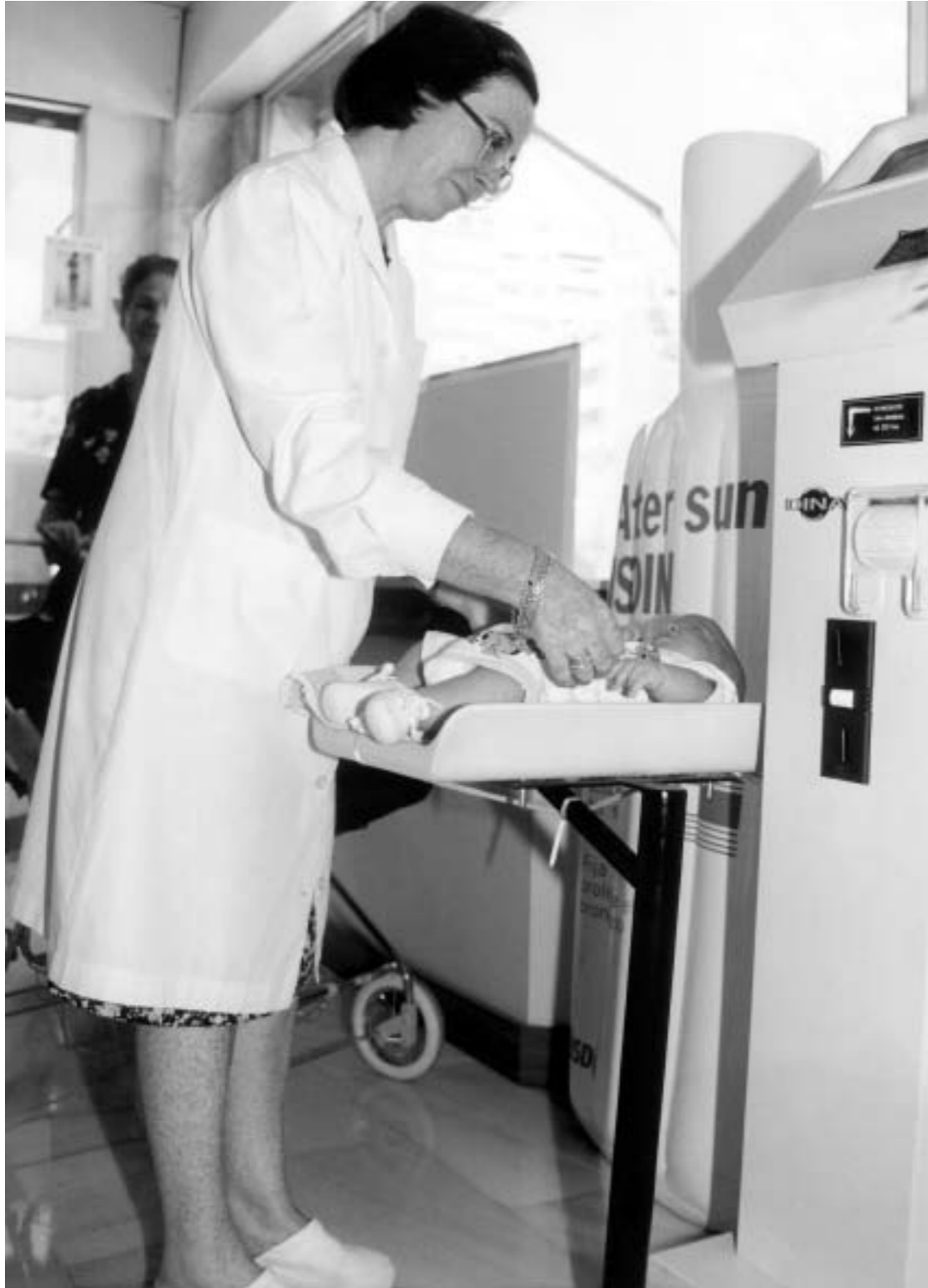
73. Pediatra. s.l.; s.f. (colección de la Secretaría Confederal de la Mujer de CC.OO.).