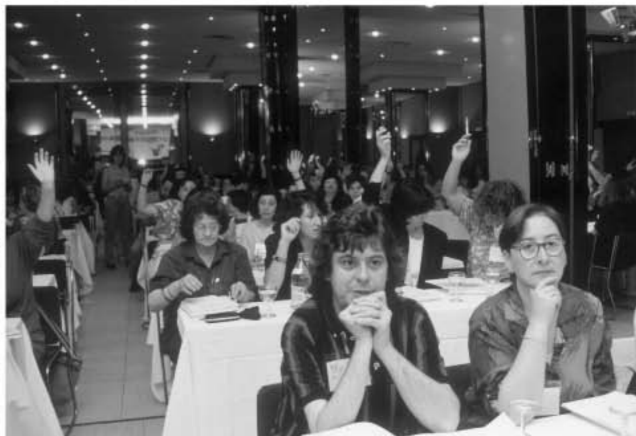
64. 1ª Conferencia CC.OO. Sindicato de Hombres y Mujeres. 1993.