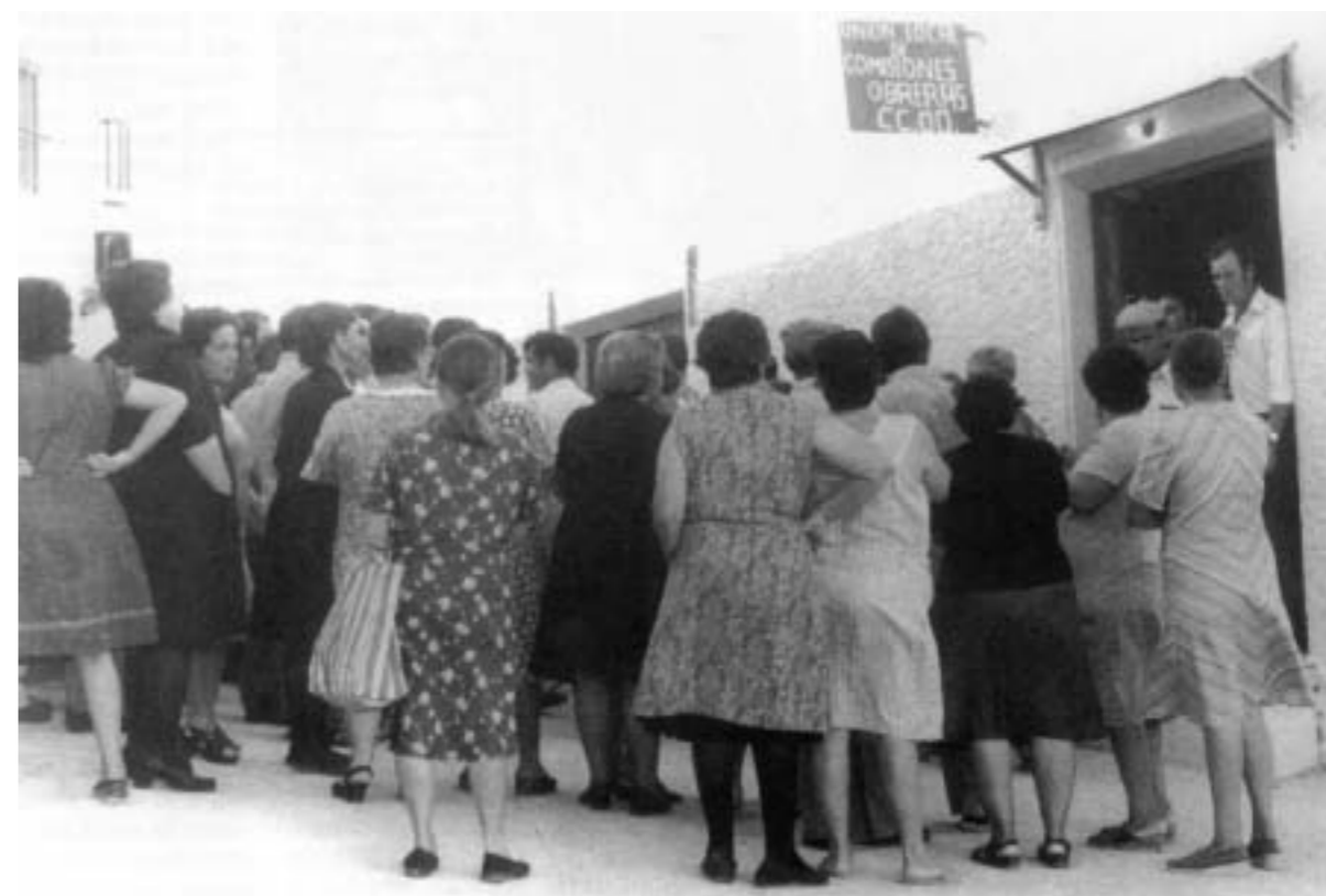
49. Miembros del comité de empresa de Bressel, en huelga por el convenio. Madrid, s. f..