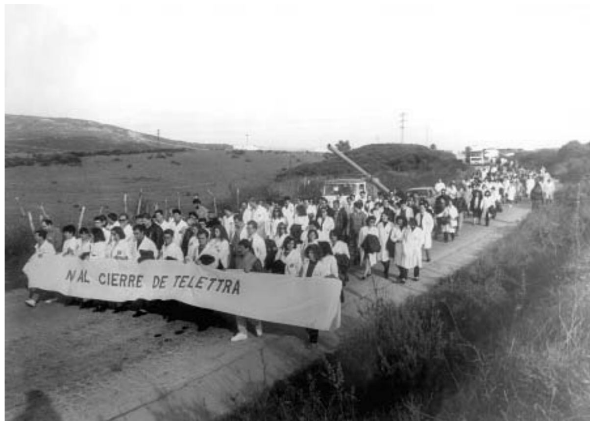
77. Conflicto por el cierre de la factoría de Telettra. San Roque, Cádiz. 1992