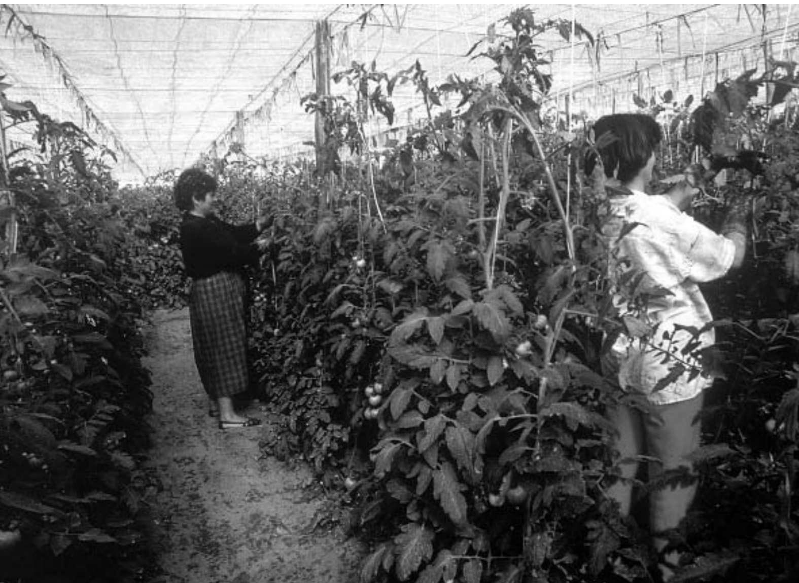
69. Trabajando en invernaderos. 1990.