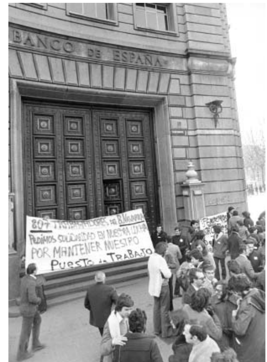
53. Trabajadoras de banca contra la discriminación en el sector. Barcelona, s.f. (Fundación Cipriano García. Arxiu Històric de CC.OO. de Catalunya).