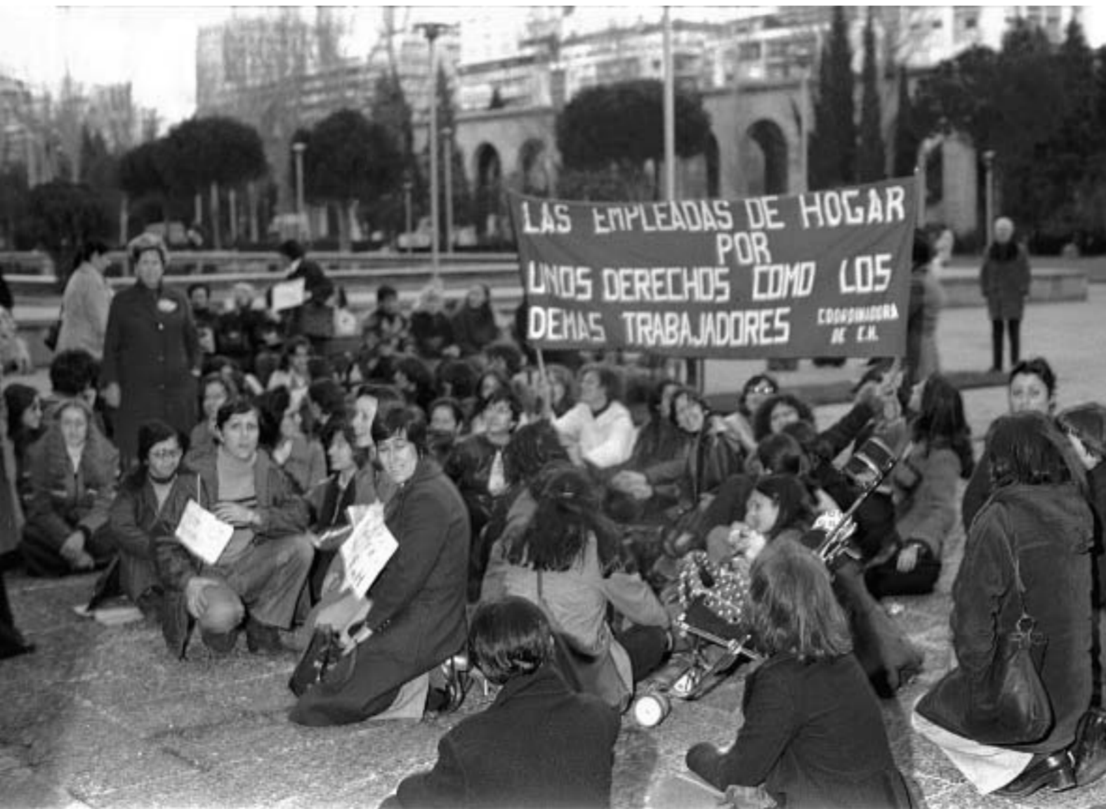
47. Manifestación reclamando derechos laborales para las empleadas de hogar. Madrid, 1978 (colección Unidad Obrera, CC.OO. de Madrid. Archivo de Historia del Trabajo, Fundación 1º de Mayo).