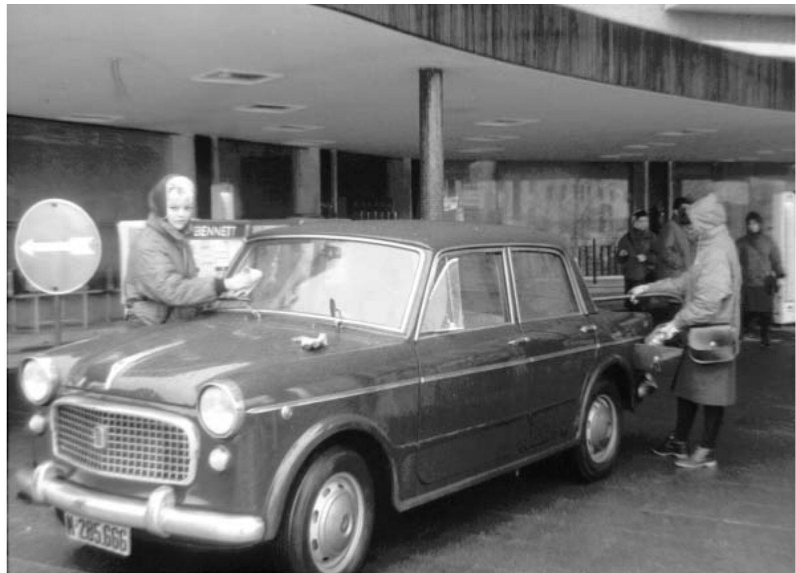
31. Mujeres sirviendo gasolina en estación de servicio. Madrid, 14 enero 1962.