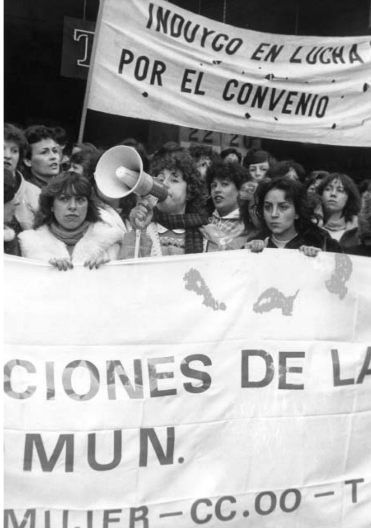
44. Induygo en lucha por el convenio.