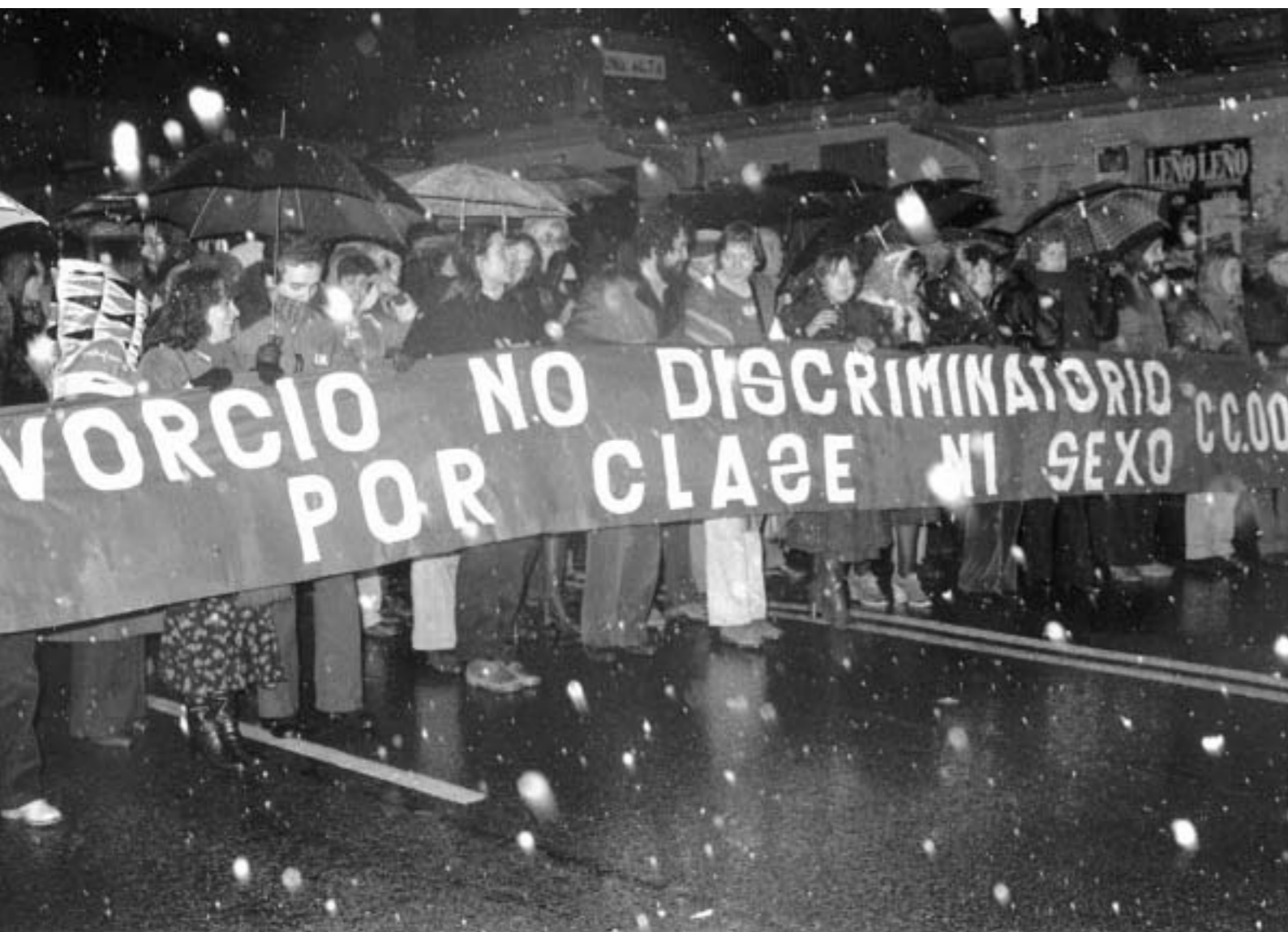
59. Manifestación contra el proyecto de ley de divorcio de UCD. Madrid, enero 1980.