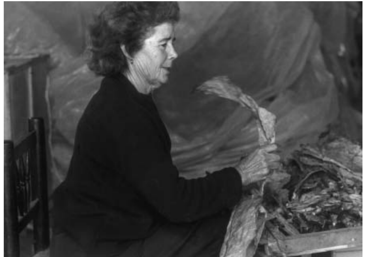
37. Preparando el tabaco para secar. Cáceres, s.f..