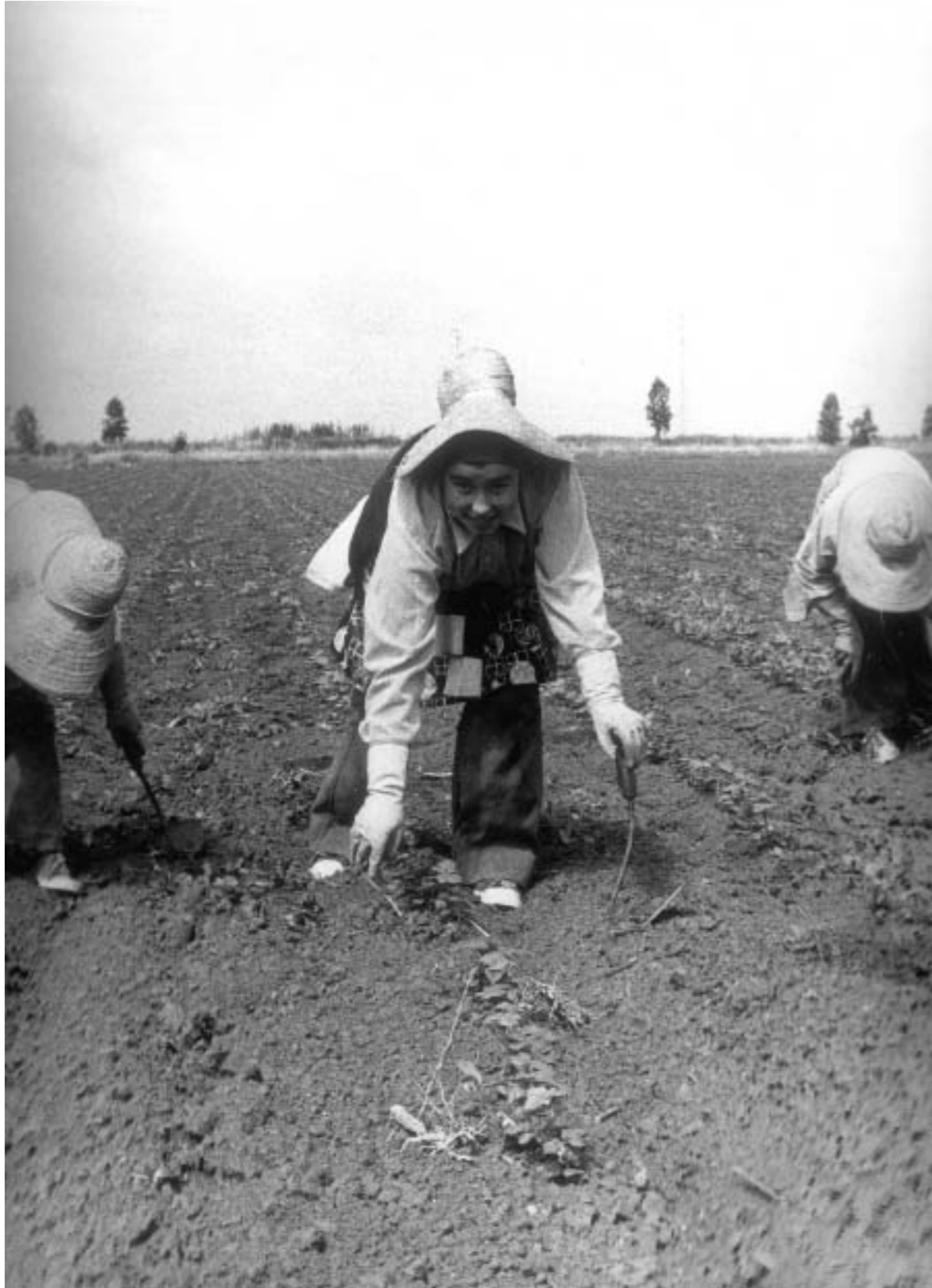
36. Jornaleras en trabajos del algodón. Los Palacios, Sevilla, 1978.