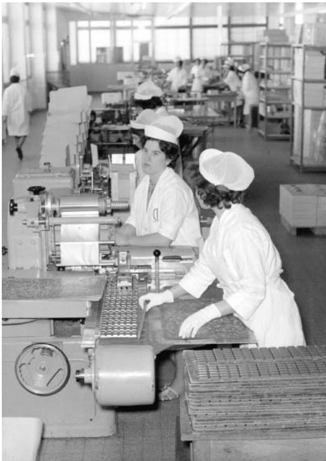
20. Trabajadoras españolas en la industria del chocolate. Bélgica, años sesenta (Centro de Documentación de la Emigración Española. Fundación 1º de Mayo).