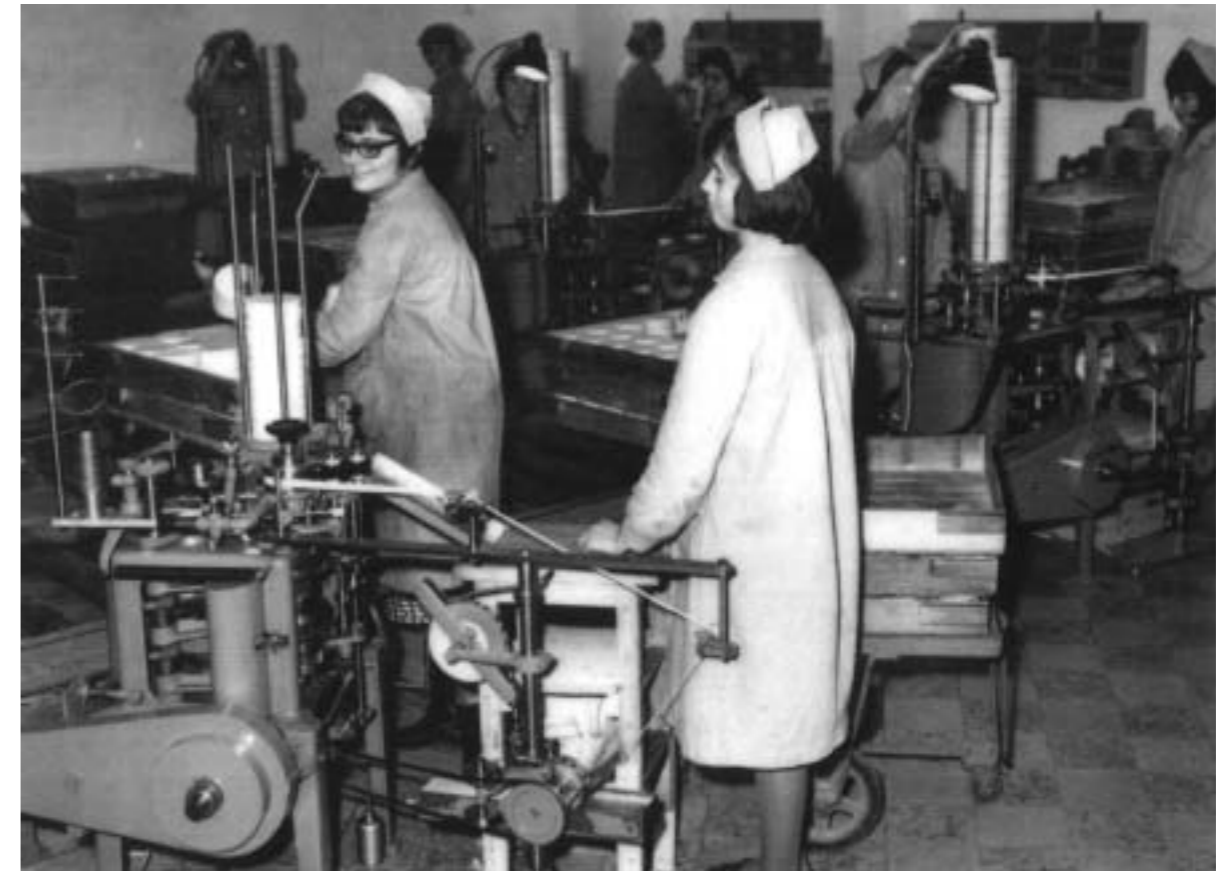
24. Trabajadora en la hilatura textil, años sesenta-setenta.