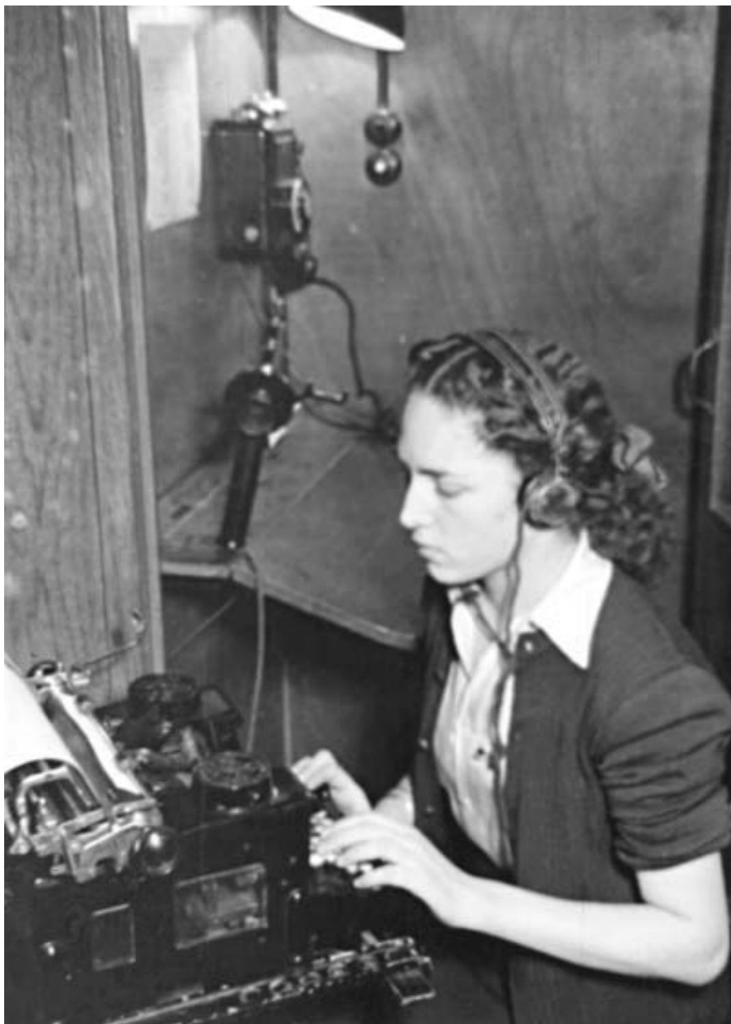
16. Mecnógrafa. Madrid, 20 enero 1950 (colección Santos Yubero, Archivo Regional de Madrid).