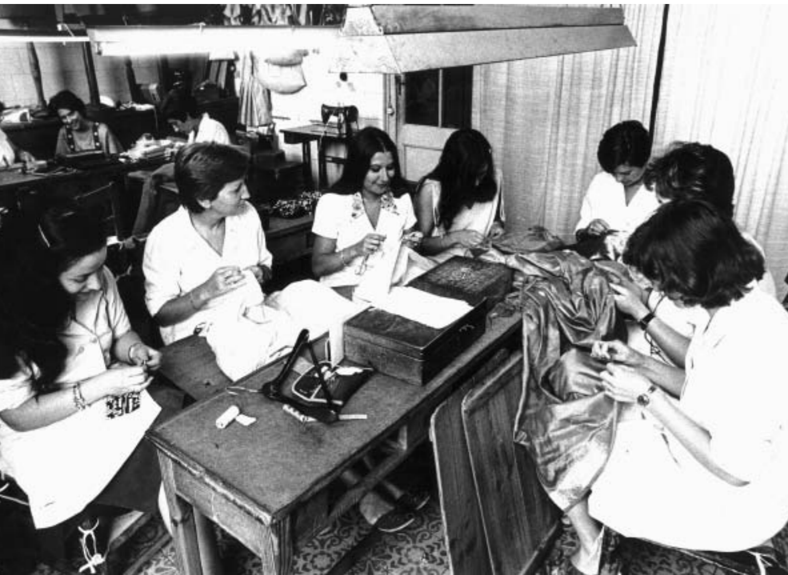
40. Talleres de alta costura Pedro Rodríguez. s. l.; s.f..