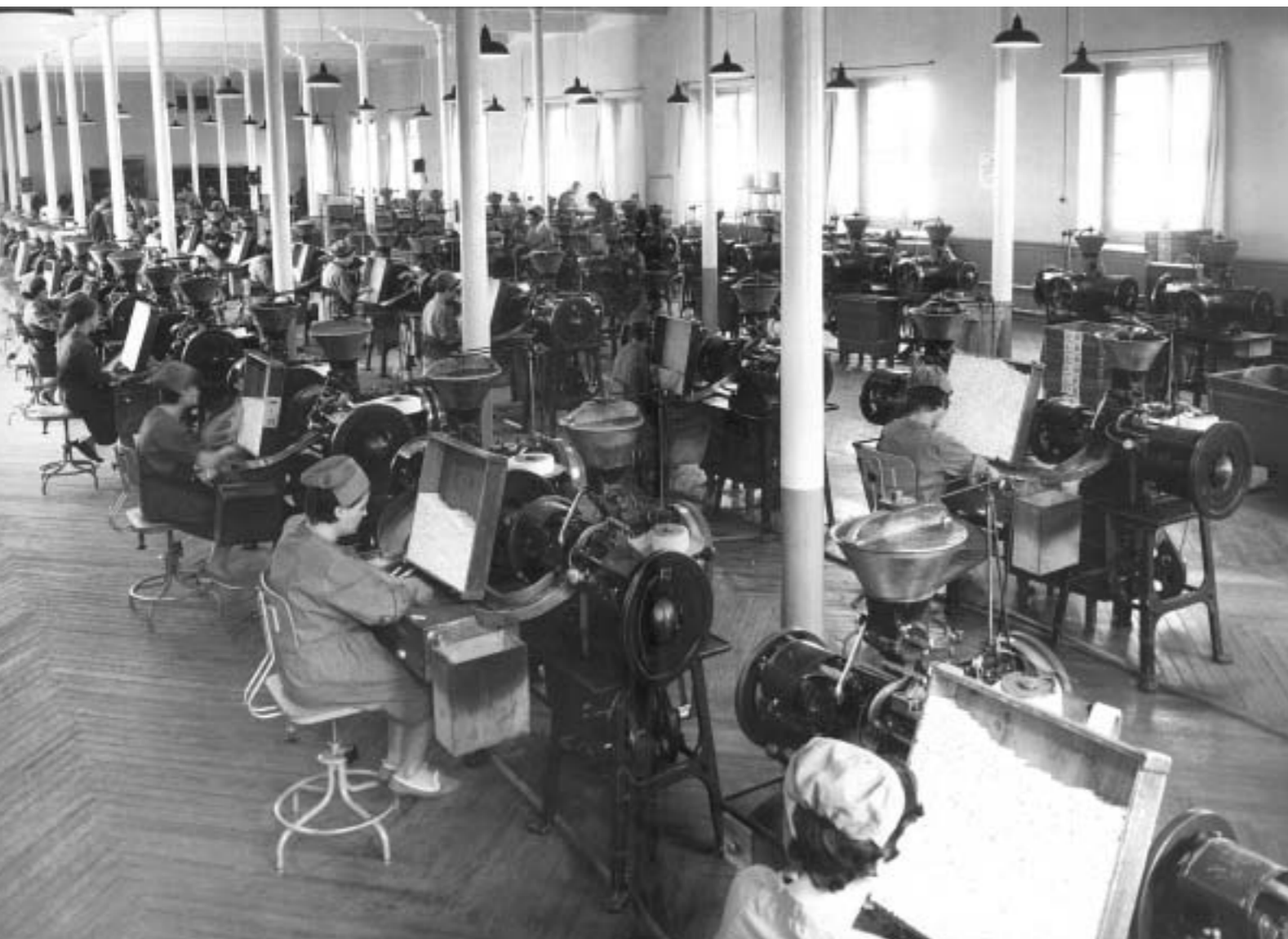
10b. Liadoras mecánicas de cigarrillos, Fábrica de Tabacos de Logroño. Años cuarenta.