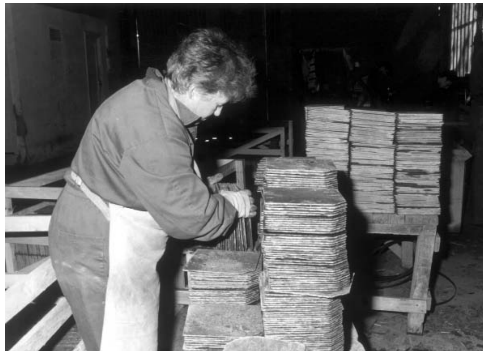
72. Mujeres trabajando en el sector de la pizarra. s.l.; s.f. (colección de la Secretaría de la Mujer de la Federación Minerometalúrgica de CC.OO.).