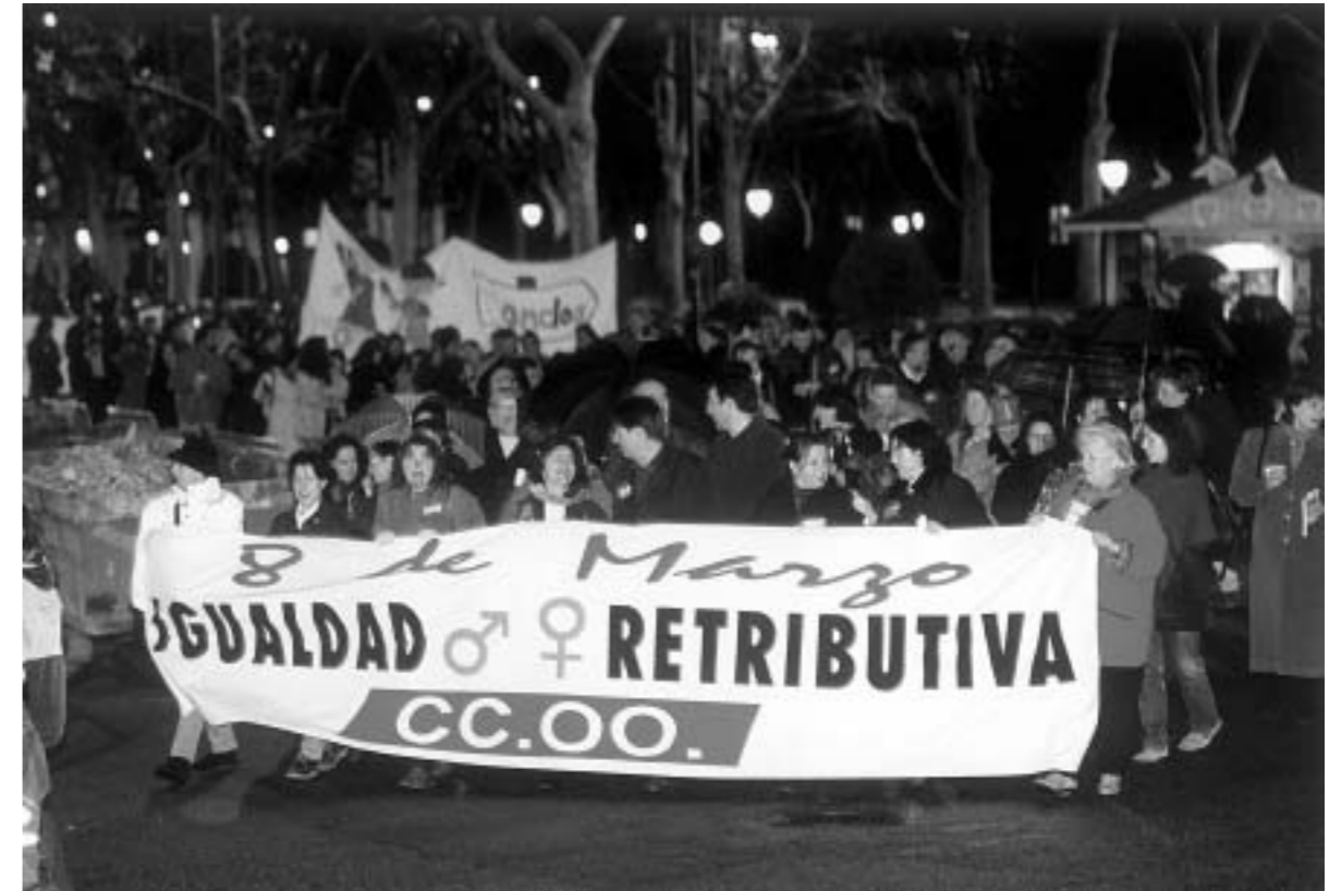
66. Manifestación 8 de marzo. s.l.; s.f.