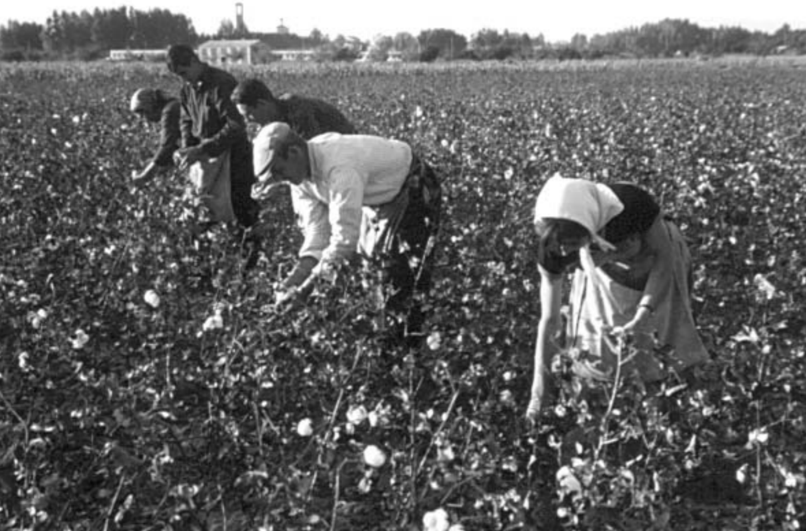
18. Recolección del algodón. Alberche del Caudillo, Toledo. 1 octubre 1964.