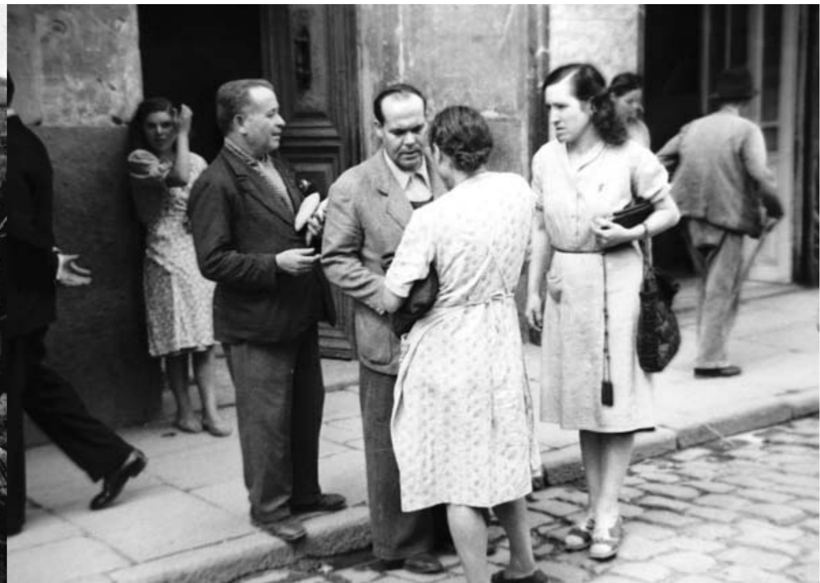
5. Estraperlando con pan y tabaco. Madrid, 25 septiembre 1948.