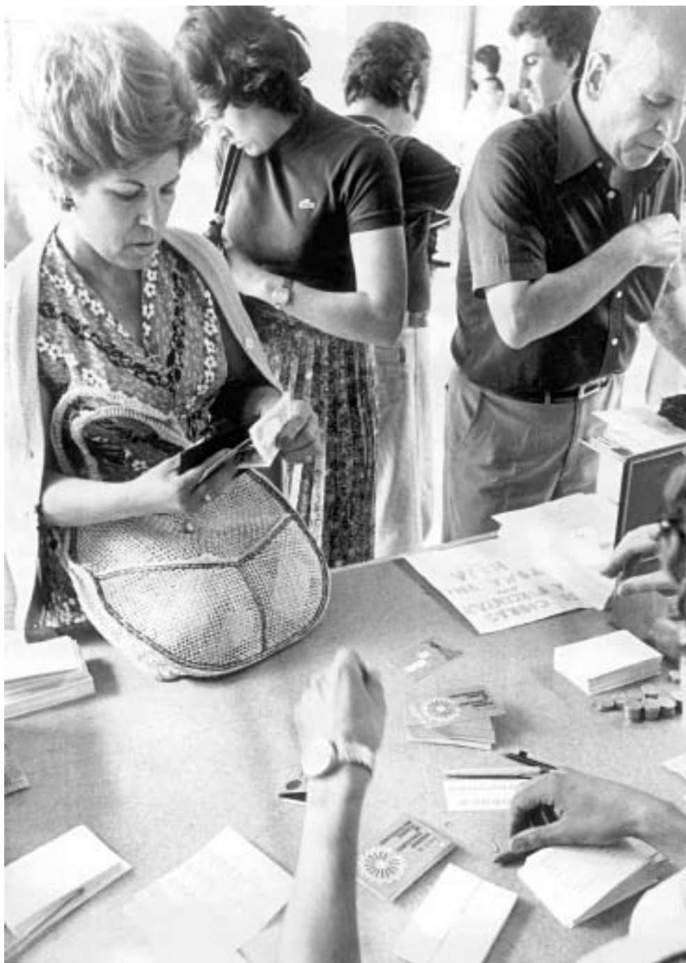
56. Entrega de carnets de CC.OO. Madrid, 1977.