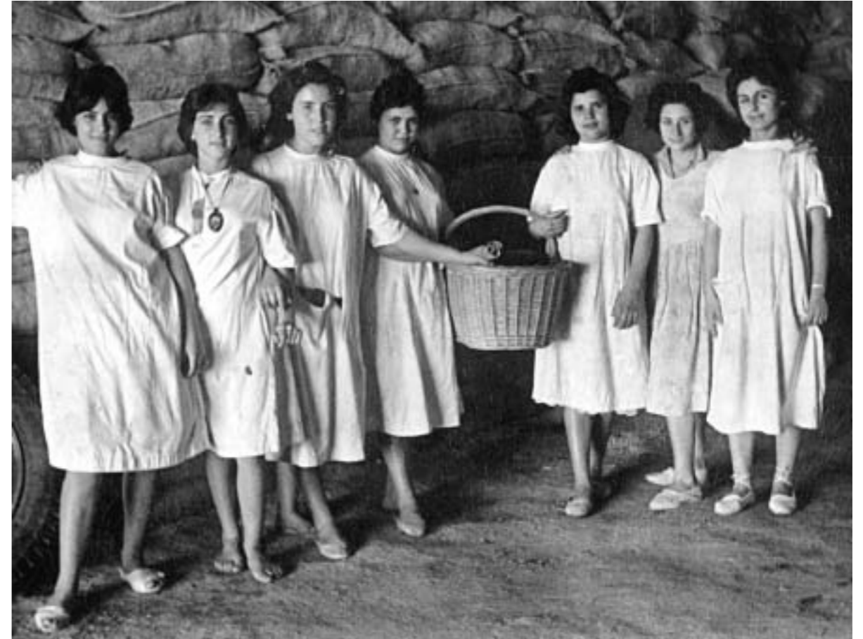
23. Almacén de sal, Madrid, 1960.