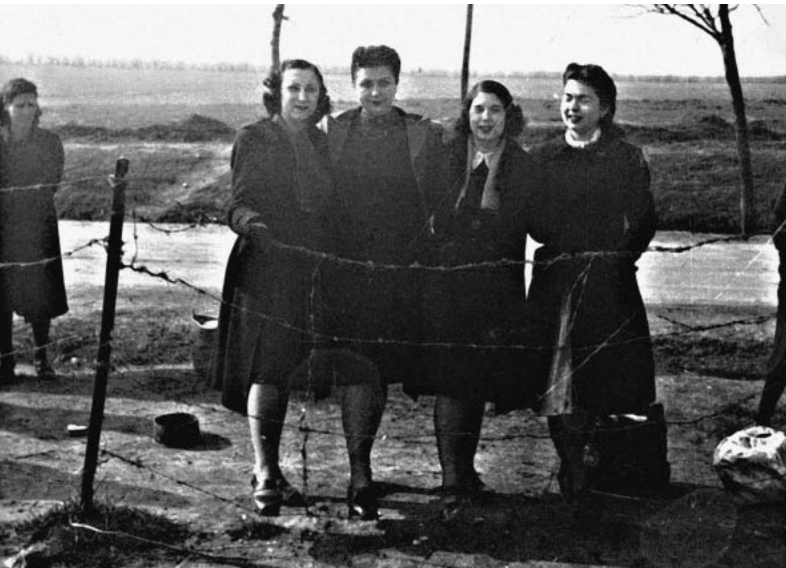
4. Familiares de presos políticos en la cárcel de Carabanchel, Madrid, años cuarenta.