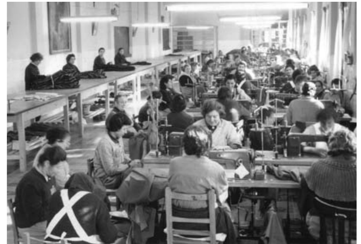
2. Pasando la frontera con Francia, febrero 1939. 3. Presas en el taller de confección de la cárcel de Alcalá de Henares, años cuarenta.