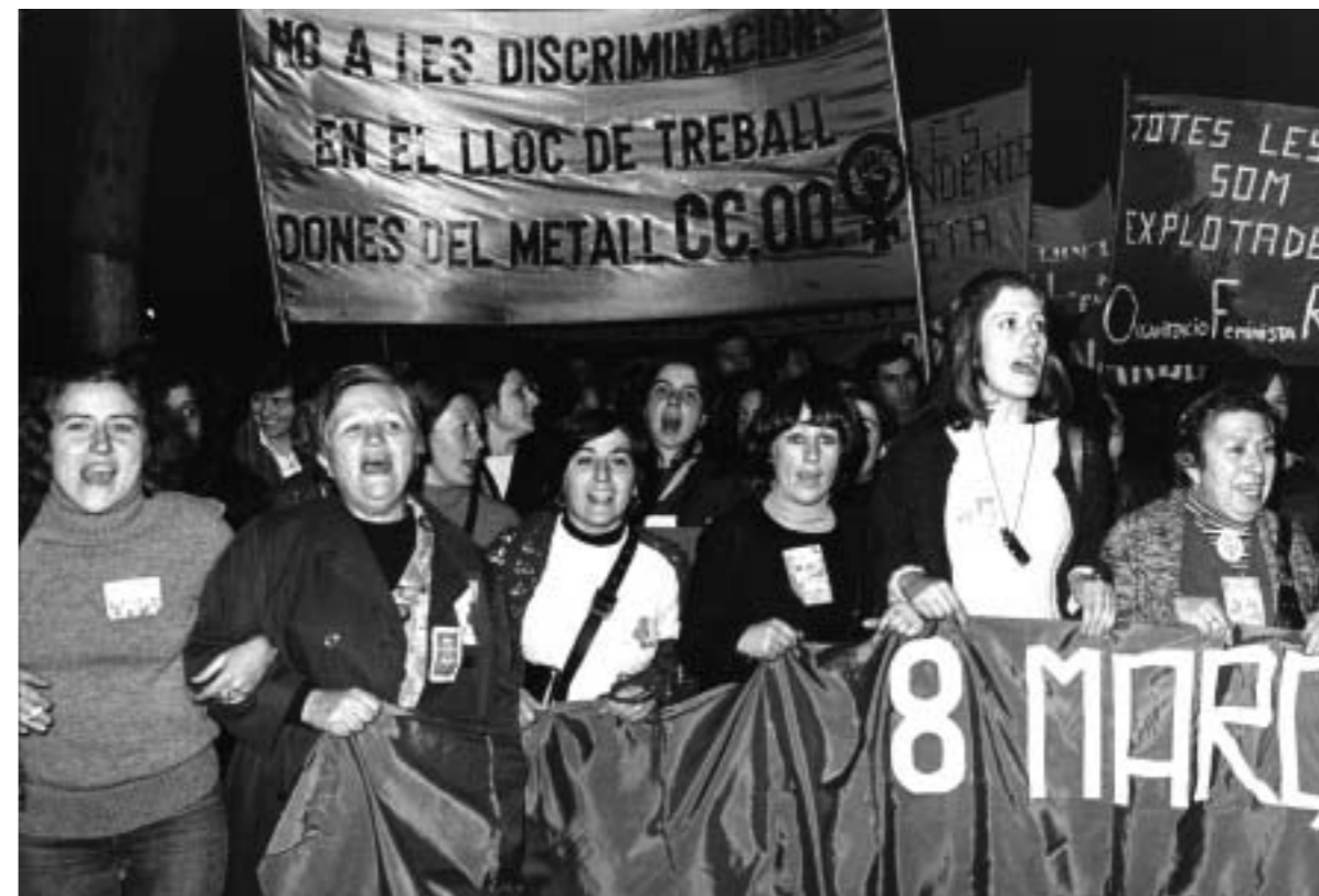
58. Manifestación por el derecho al aborto. s.l.; s.f..