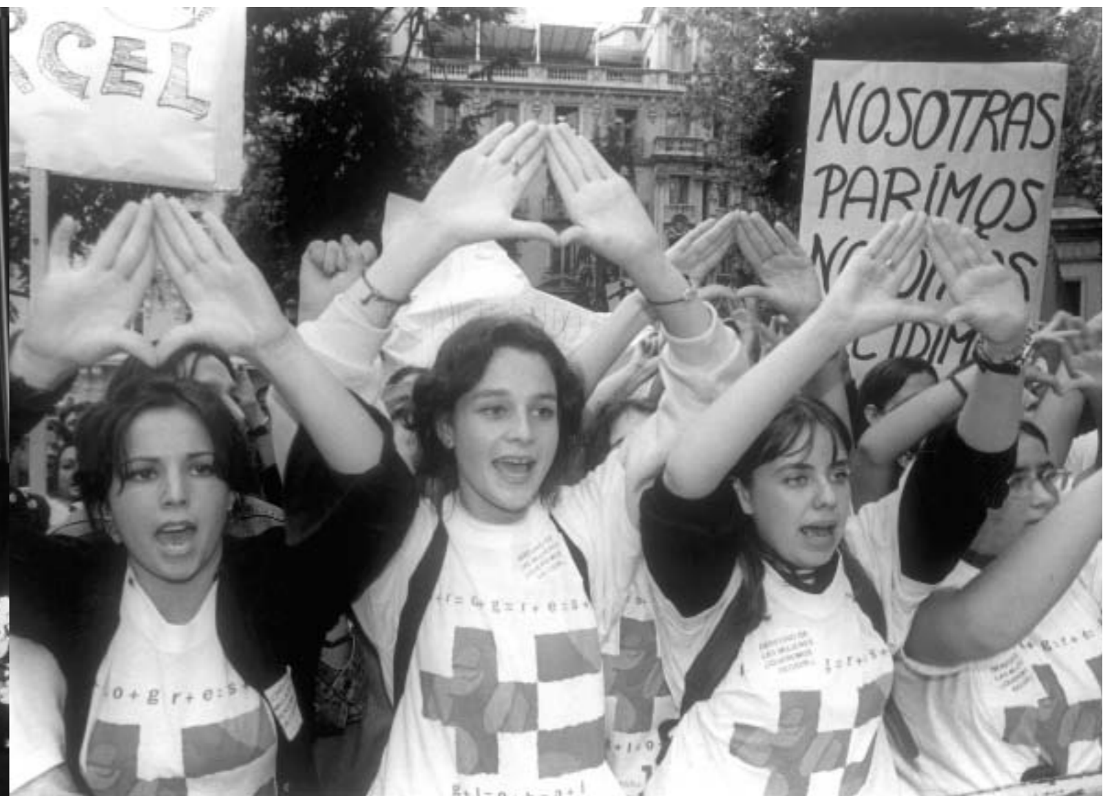
68. Manifestación por el derecho al aborto. Madrid, 22 septiembre 1998 (foto Manuel Blázquez, colección de la Secretaría Confederal de la Mujer de CC.OO.).