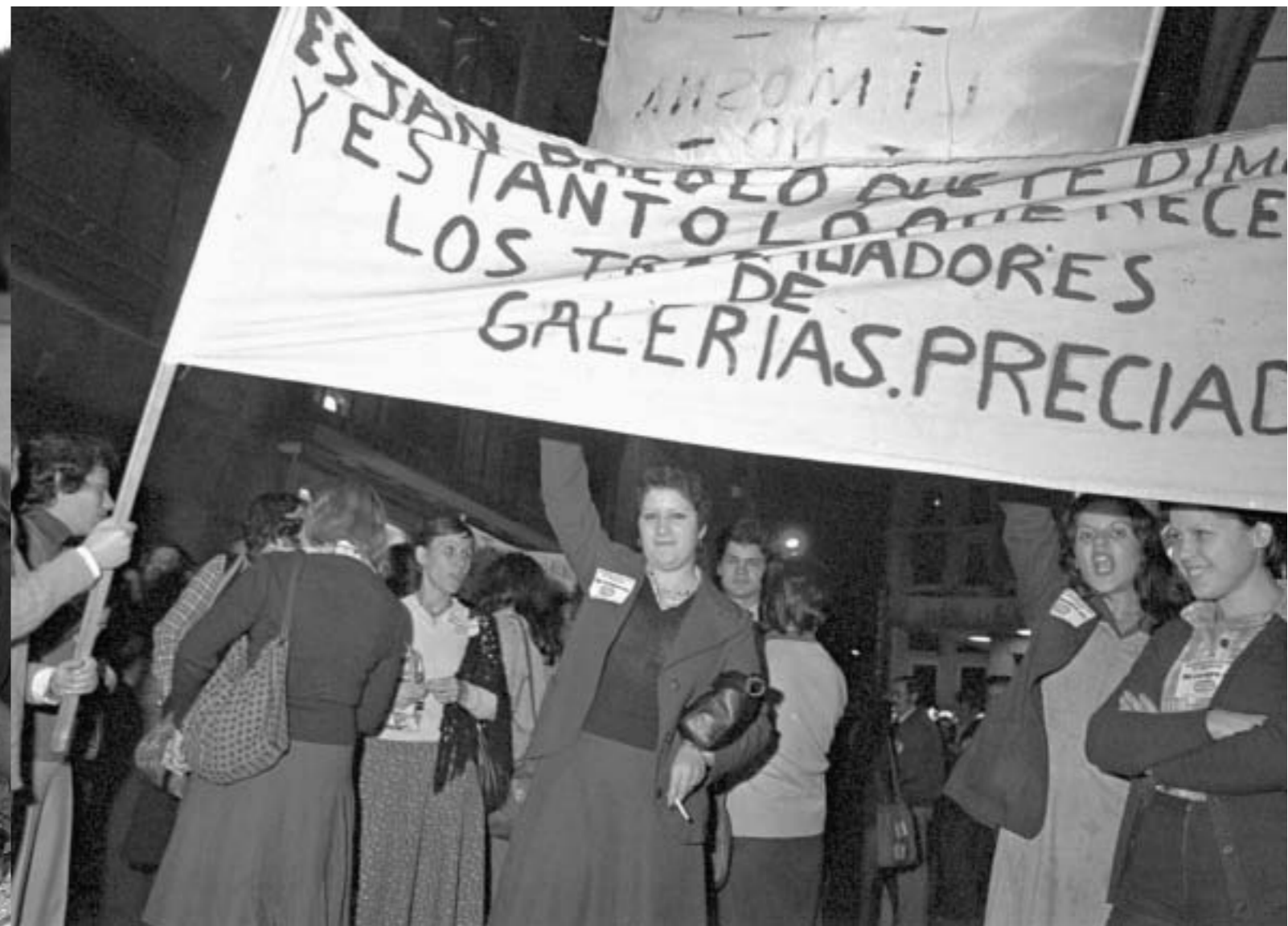
48. Manifestación de las trabajadoras de Galerías Preciados. Madrid, 22 octubre 1977.